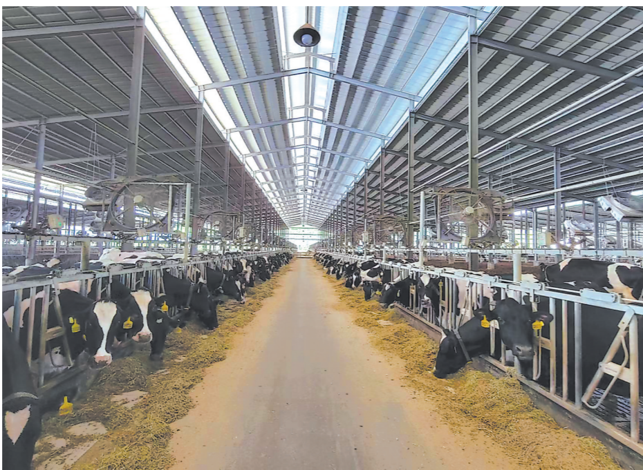
鸿瑞生态农业产业园奶牛养殖场

奶业是南平市延平区特色产业之一。上世纪60年代延平就成立了国营乳牛场,并诞生了长富、大乘等大型知名乳制品企业。最新数据显示,当前,延平共有14家规模奶牛养殖场,奶牛存栏量达2万余头。延平位于闽江干流源头,这里山峦叠翠,碧水悠长,有“闽江之珠·门户城市”之美誉。然而,早些年,延平的奶牛养殖模式以传统粗放型为主,粪污处理设备较为简陋,时常出现废弃固体和粪污乱丢、乱排现象,延平生态环境保护面临重大挑战。近年来,延平区在“两山两化”理论指引下,积极推动奶牛标准化生态健康养殖,积极探索实行“牛—沼—菜”和“牛—沼—草”的种养生态循环模式,实现奶牛粪便的综合化利用;总结制定奶牛疫病综合防控技术方案,筑牢奶业食品安全防线,最大化降低奶牛养殖对生态环境的影响,推动奶业绿色生态高质量发展。