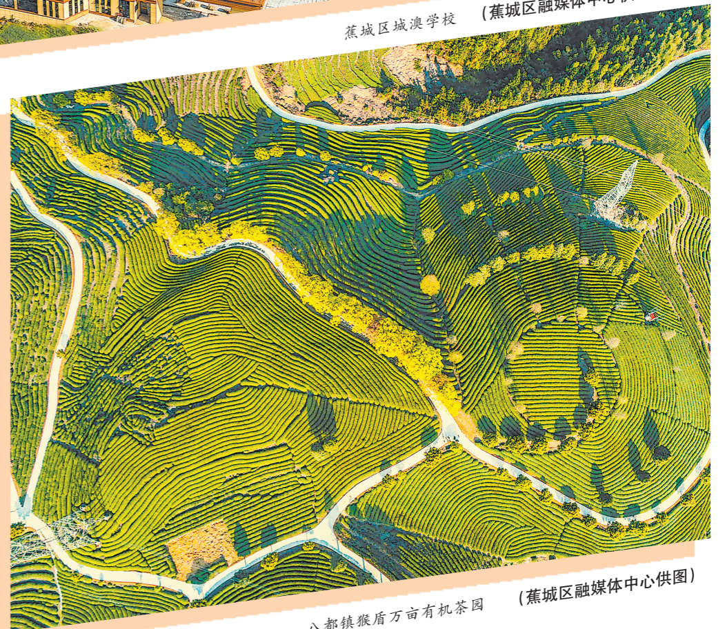
八都镇猴盾万亩有机茶园