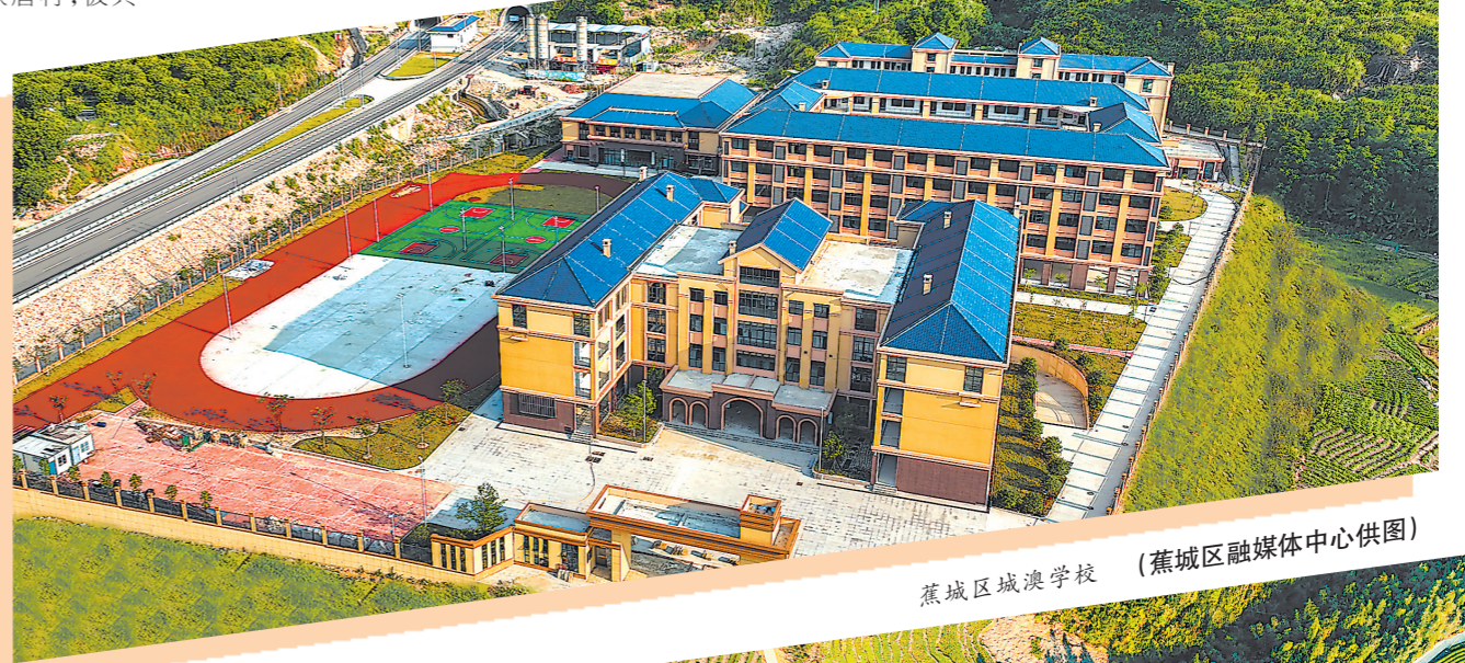
蕉城区城澳学校