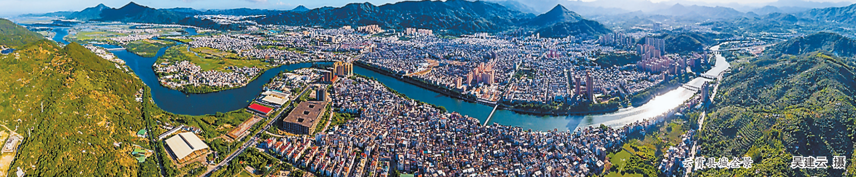
云霄县城全景

“何当凌云霄，直上数千尺”“峻节贯云霄，通方堪远大”……在古诗词中，“云霄”二字，意象辽阔高远。