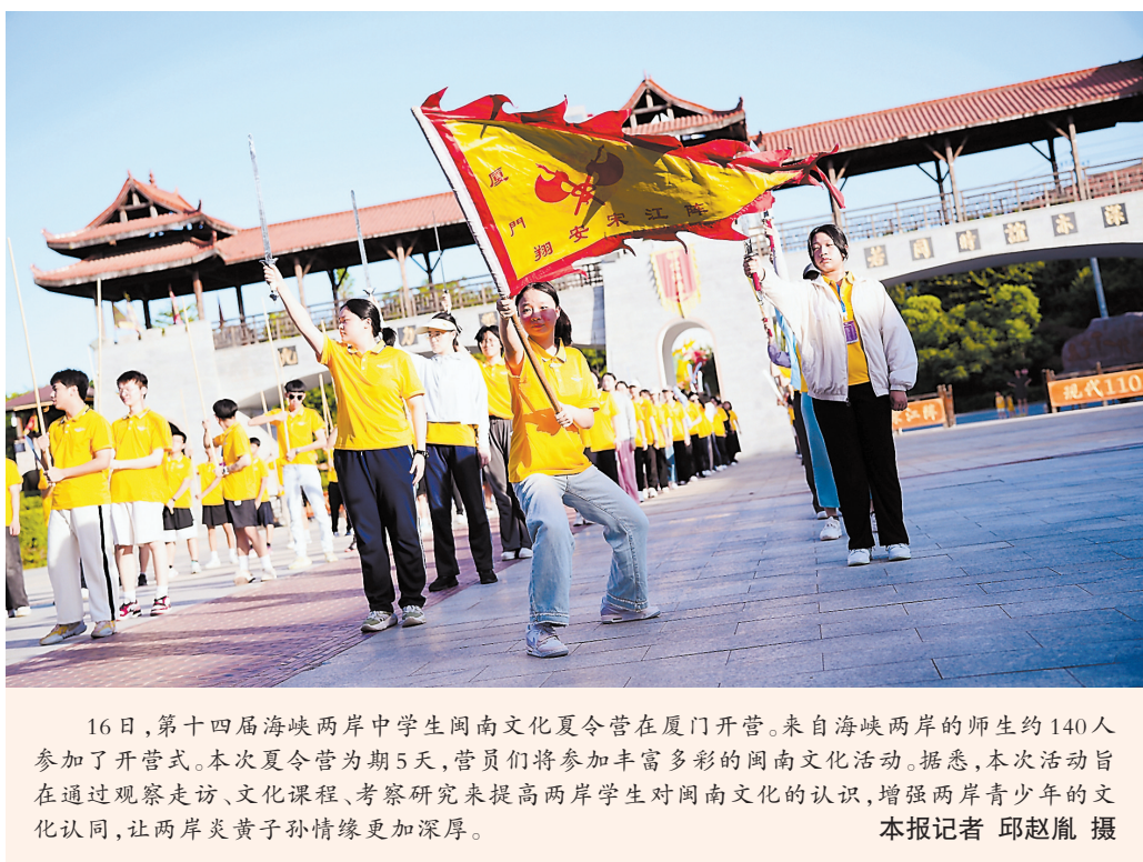
16日，第十四届海峡两岸中学生闽南文化夏令营在厦门开幕。来自海峡两岸的师生约140人参加了开幕式。本次夏令营为期5天，营员们将参加丰富多彩的闽南文化课程。据悉，本次活动旨在通过观察走访、文化课程、考察研究来提高两岸学生对闽南文化的认识，增强两岸青少年的文化认同，让两岸炎黄子孙情缘更加深厚。

进口方面，铝材、铜矿砂、纸浆增势抢眼，分别进口15亿元、19.4亿元、17.7亿元，分别同比增长98.9%、54%、53.2%。