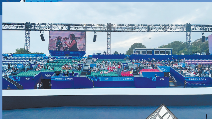
◀开幕式看台 肖榕摄