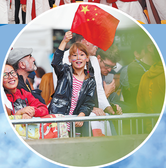
▶观众在看台上。