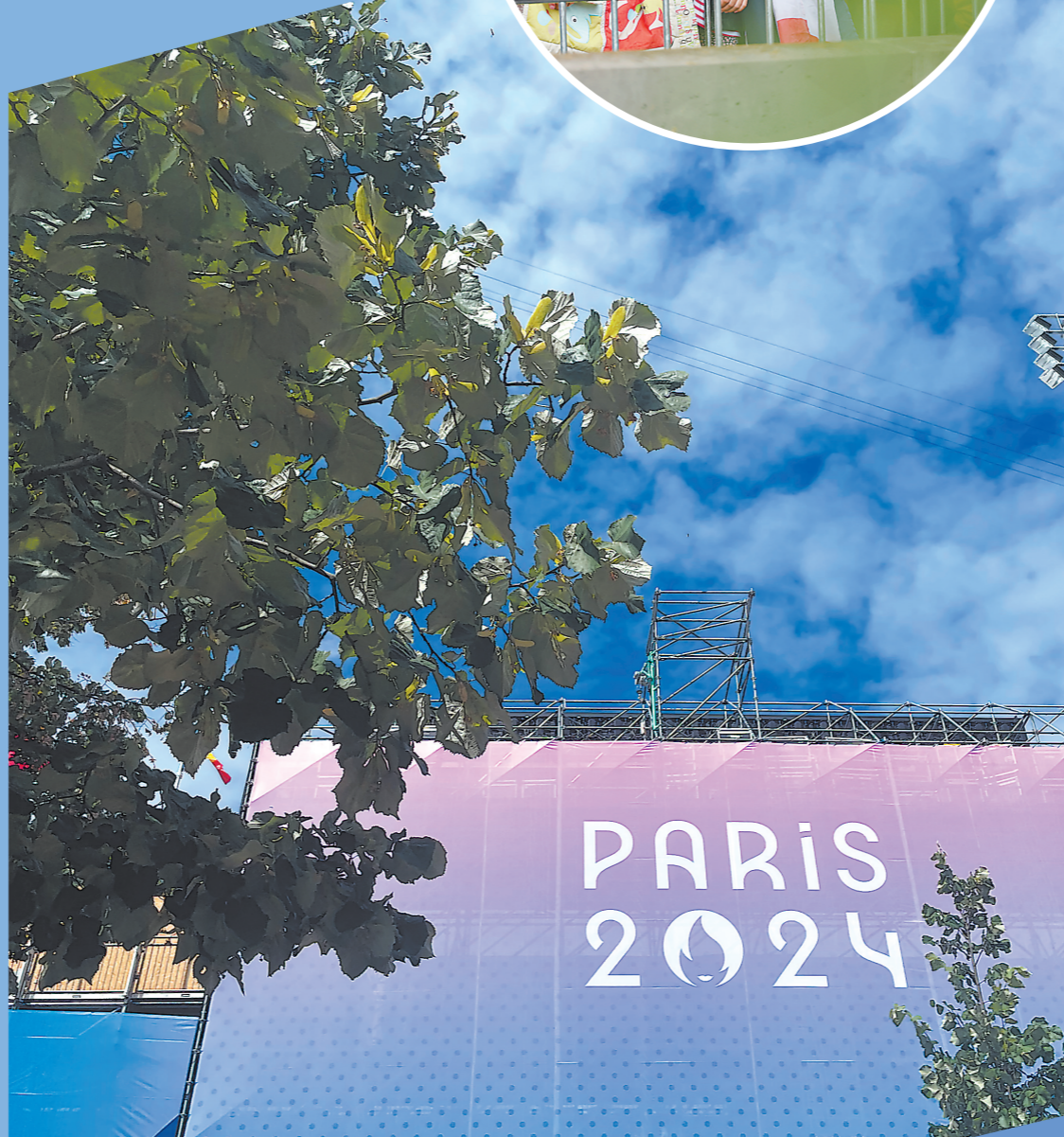
▲巴黎荣军院射箭场馆